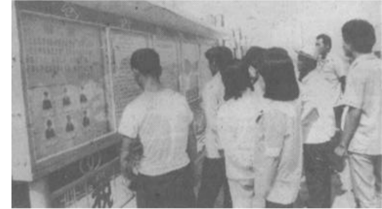
国家新增加的13项专控商品，如书写印刷纸、布匹及制品、针织品等，按可比口径计算，今年专控商品支出数比去年同期还减少了6万元，减少4%。（隋振明）

今年上半年，我市县以上社会集团购买力累计支出2807万元，比去年同期的2570万元增加237万元，增长9%，若剔除物价上涨因素和不可比因素，实际比去年同期还略有降低。其中专项控制商品支出174万元，比去年同期的138万元增加36万元，增长26%，若剔除今年