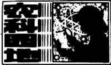
(景花 张雨 玉峰)