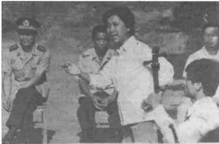
△ “八一”期间，广饶县吕剧团深入基层为烈军属和军人进行慰问演出。图为他们正在为县武警中队演出。